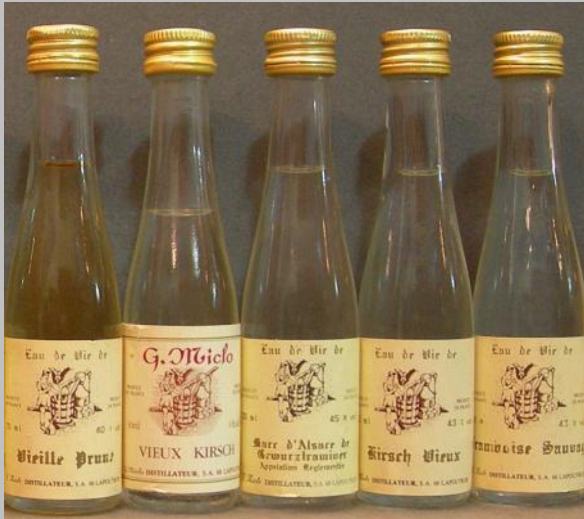
Otros aguardientes de frutas 1. Vielle prune, 2 vieux kirsch, 3 Marc de Alsace, 4 Kirsch, y 5 Framboise sauvage.