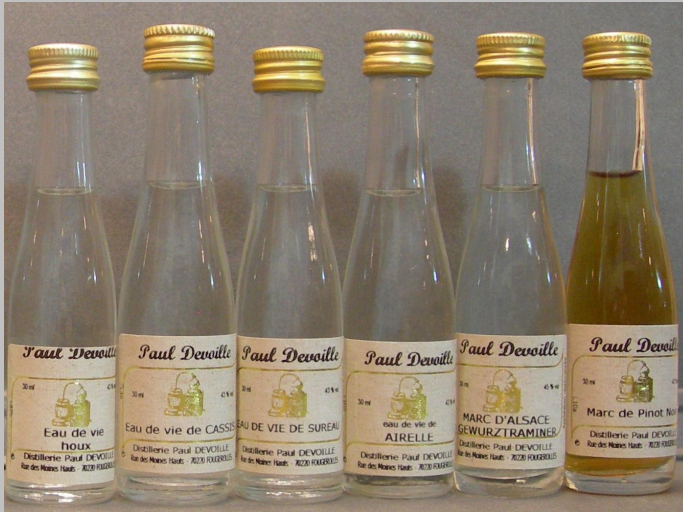
En la foto aguardientes de 1. Houx, 2 Cassis, 3 Sureau, 4 Airelle, 5. Marc de alsace y 6 Marc de pinot, todas ellas de la casa devoille.