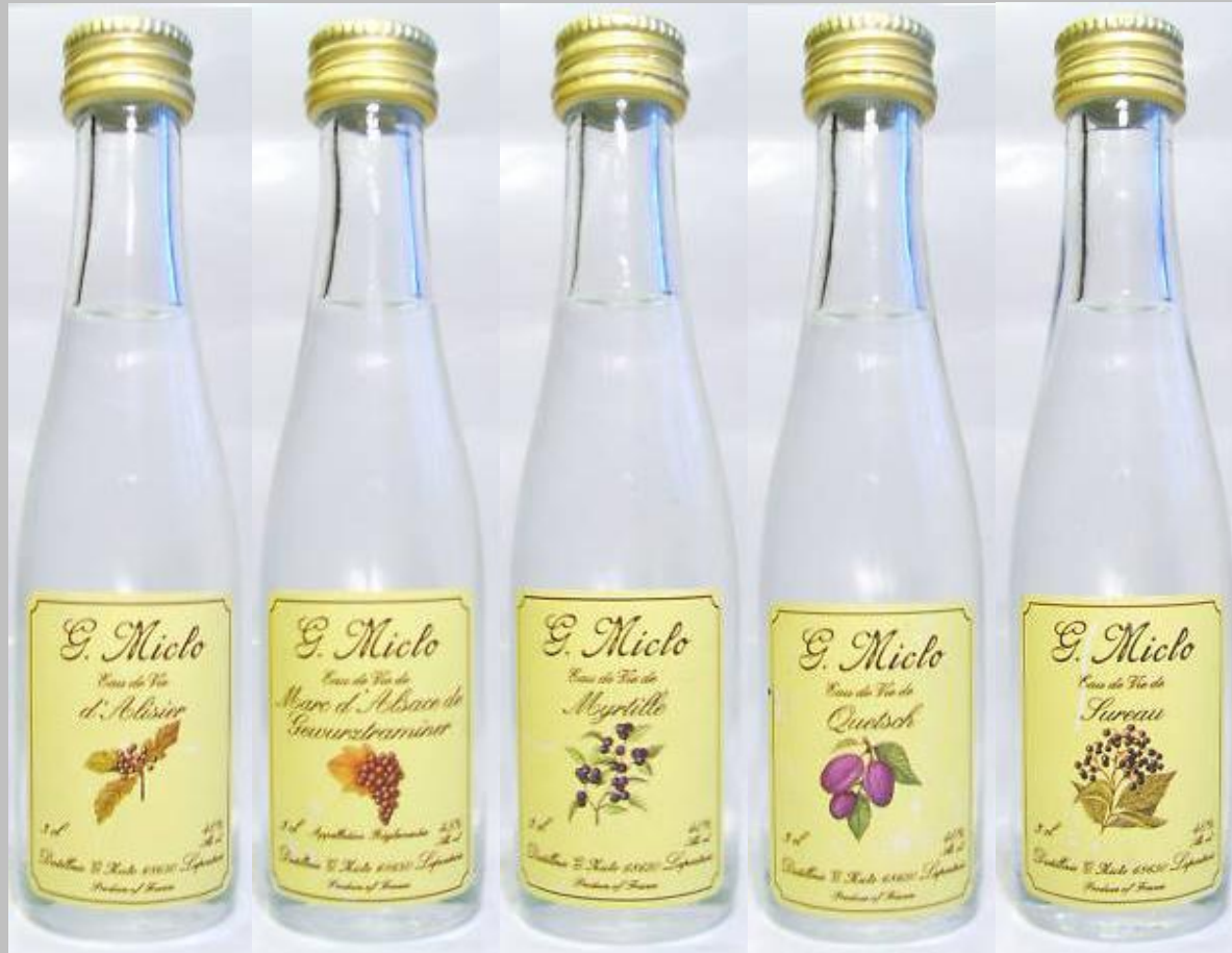
En las fotos miniaturas de la casa Miclo con presentaciones de Alisier, marc, myrtille, quetch y sureau, todas de 40ml y 40% de alcohol.