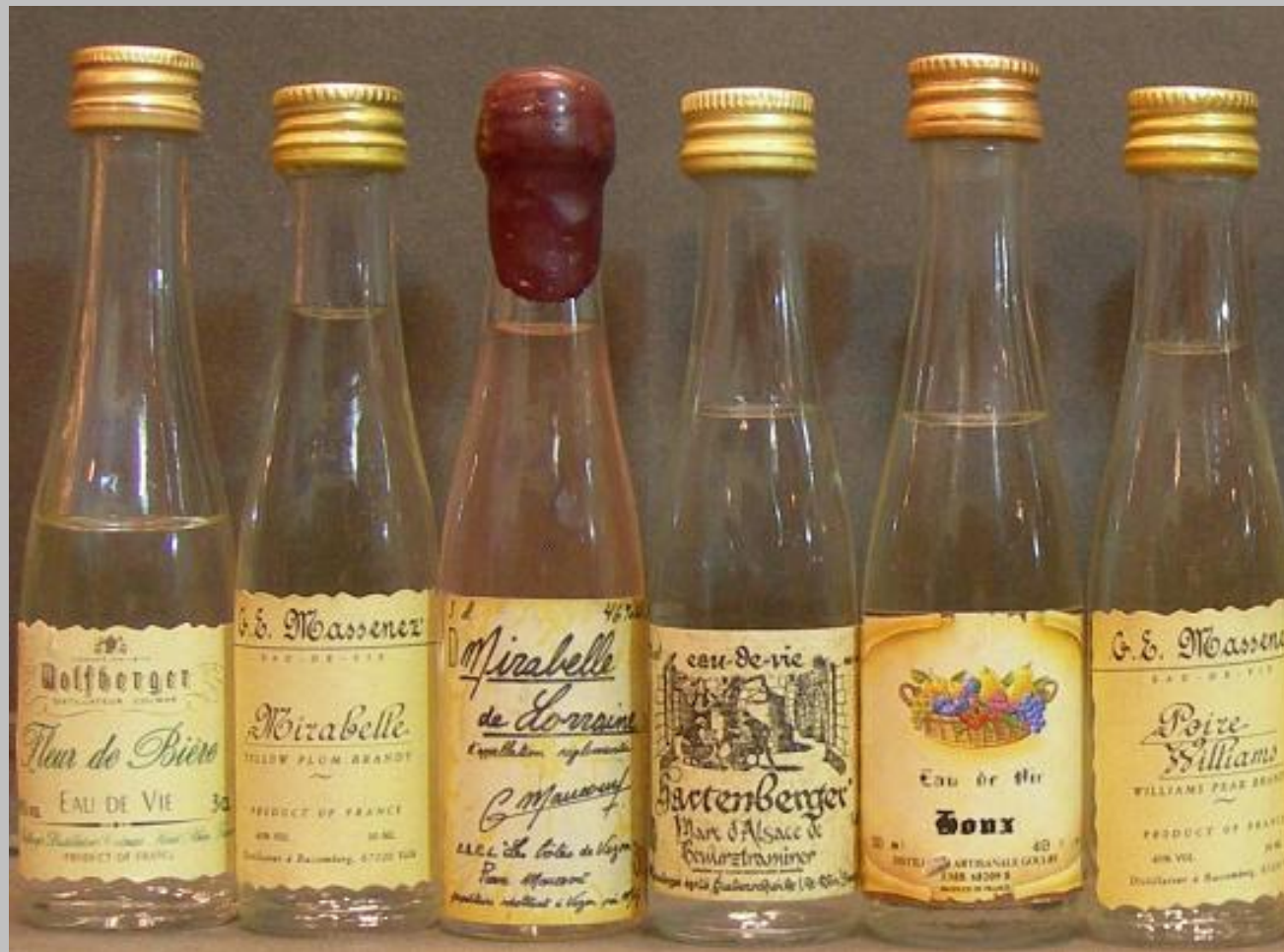
Aguardientes de 1. Fleur de biere, 2. mirabelle de Massenes, 3.Mirabelle de Lorraine, 4.Houx y 5. Poire williams