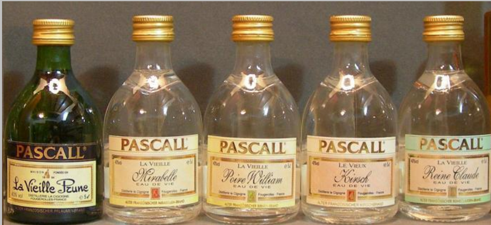
Miniaturas de eau de vie de la marca Pascall, 1. Vielle Prune (de ciruela), 2. Mirabelle (de ciruela tipo mirabelle), 3 Poire williams (de durazno), .4.Kirsch (de cereza) y 5. Reine Claude (de ciruela tipo claudia).