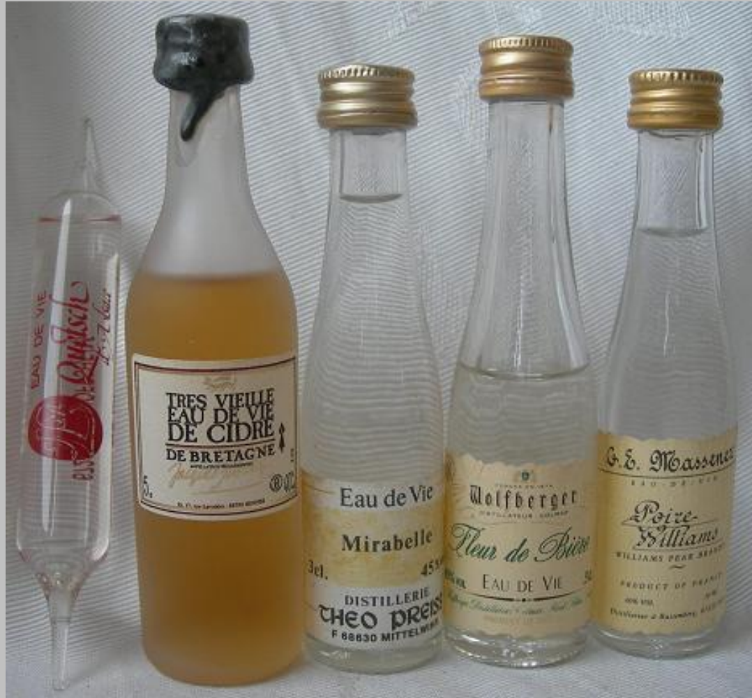
En la foto aguardientes de fruta como 1. Quetsch de Alsace en presentación de ampolleta, 2 Eau de vie de cidre, 3. Eau de vie de Mirabelle Theo, 4. Fleur de Biere wolfberger, 5 poire williams masesenes.