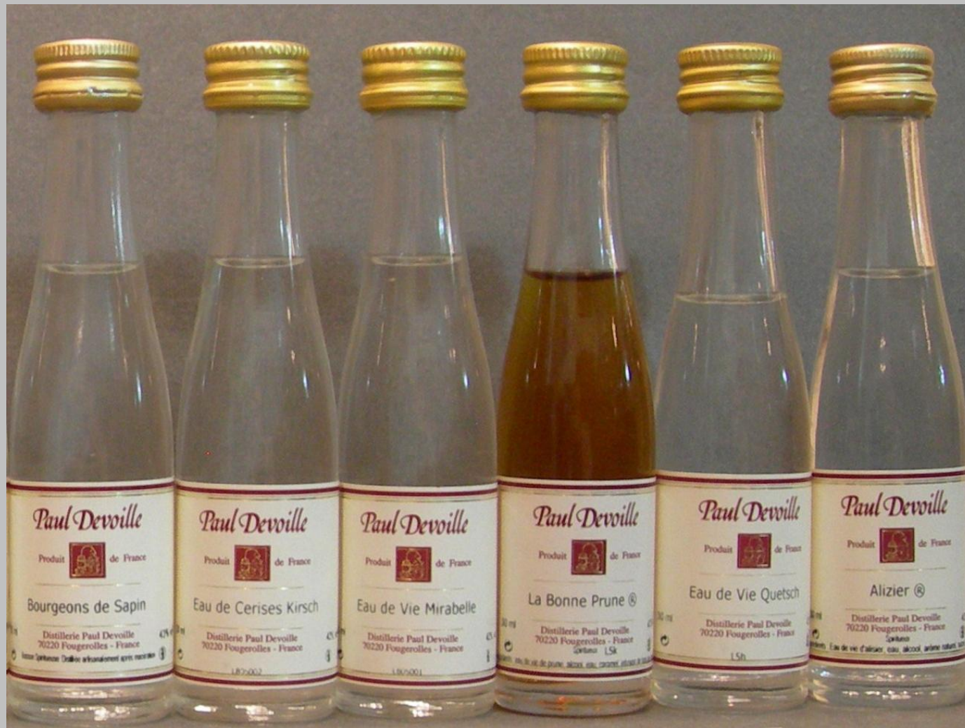
Eaux de vie Borgeons de sapin, cerises kirsch, bonne prune, quetsch y alizier