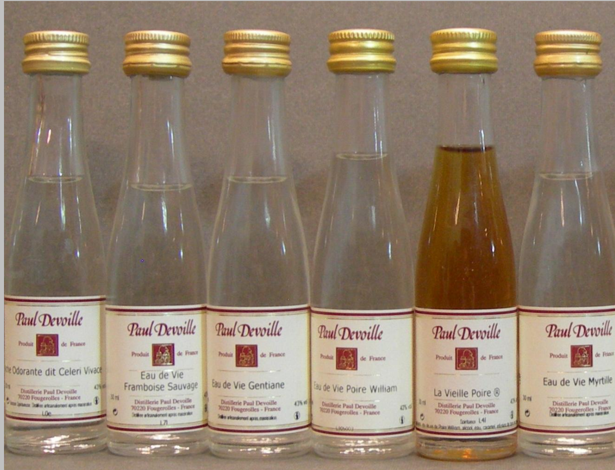
Otros eau de vie de la casa Paul Deville son 1.Eche odorante, 2 Framboise sauvage, 3. Gentiane, 4. Vielle Poire, 5 Poire williams y 6. Myrtille